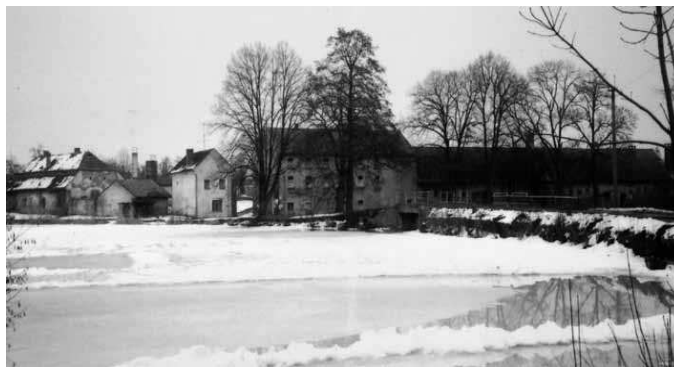
Obr. 2 Bývalý cukrovar Třebovětice (snímek z roku 2002)

(vyobrazení z první poloviny 60. let 19. století)