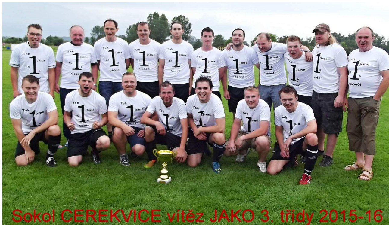
Sokol CEREKVICE vítěz JAKO 3. třídy 2015-16