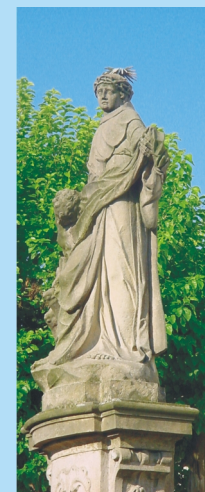
Sv. Jan z Boha