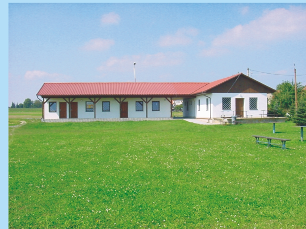
Zázemí u fotbalového hřiště.

Parkování vozidel návštěvníků zajištěno na označených vyhrazených místech !