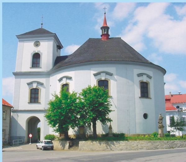
Kostel v Cerekvici nad Bystřicí